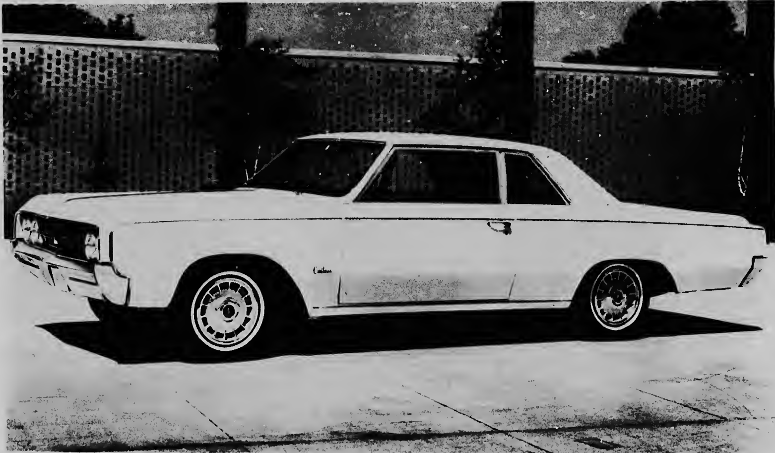
1964 OLDSMOBILE "CUTLASS" HOLIDAY COUPE